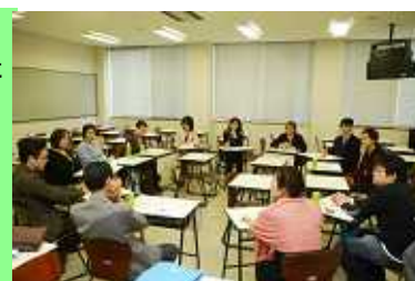
領域(学部別)毎の交流会・勉強会