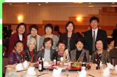
パーティーでの記念写真