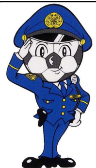
県警マスコット エスビーくん