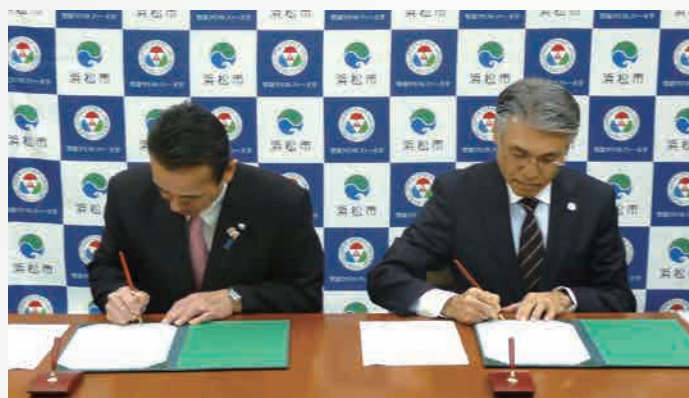
鈴木康友浜松市長(左)、大城昌平学長(右)

けた地域社会の推進に関する事、(5)本協定の目的を達成するために必要な活動、調査研究、報告などの連携協力事項について、既存の連携事業に新たな事業を加え推進していく予定です。