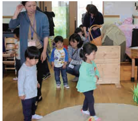
エッグハントの様子

新しい生活の一步を踏み出した子どもたち、一人ひとりに備えられた賜物(才能)を見つけ共に喜び育んでいきたいと思えます。