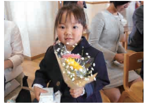
ガーベラの花束と洗濯石鹸のプレゼント