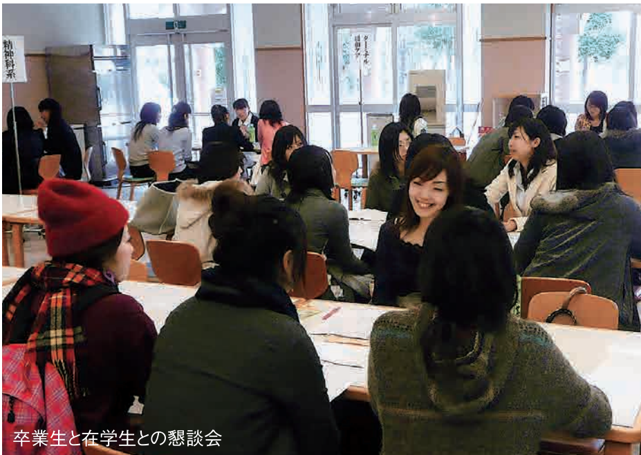
卒業生と在在学生との懇談会