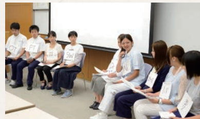
4年次生:グループ発表

また、1年次生は9月15・16日の2日間、「専門職連携の基礎」に取り組みました。教員・4年次生によるプレゼンテーションやビデオ学習などを通して「専門職連携」について感じたことや考えたことをグループに分かれてまとめ、発表会を行いました。