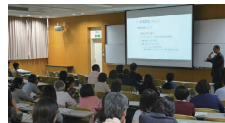
学科別説明会(リハビリテーション学部)