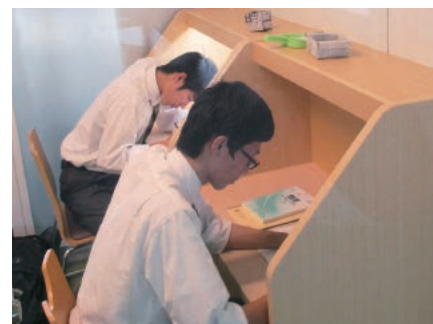
学習に集中できる個人ブース

たけれど、友達や先生たちがいてくれたので、いつも以上に頑張ることができた。機会があれば、また参加したい」などと書かれていました。