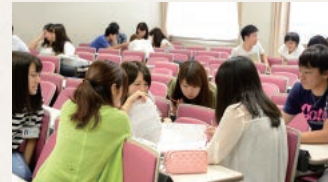
1年次生:グループワーク