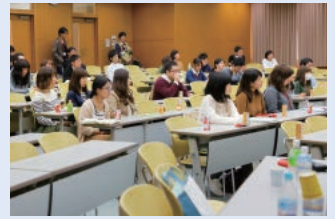
リハビリテーション系