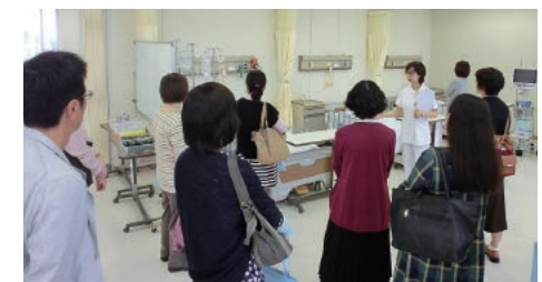
教員による実習室の紹介(看護学部)