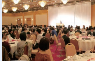
オークラアクティホテル浜松 で開催したパーティ