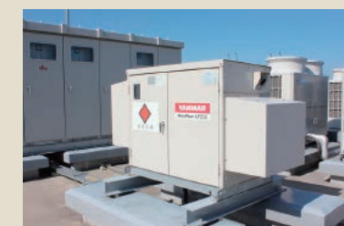
災害時に大型発電機をトイレ給排水用として操作します。