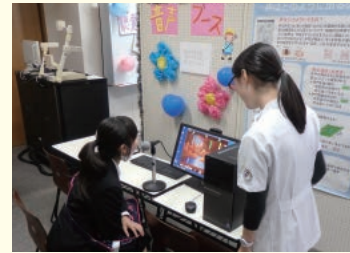
言語聴覚学科/音声ブース