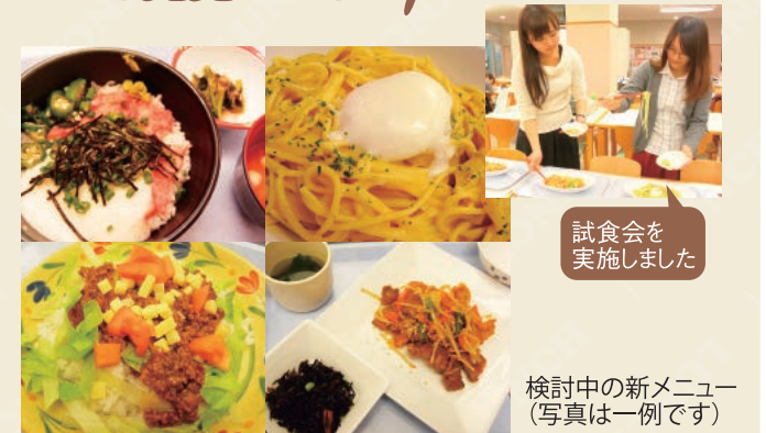
試食会を実施しました

毎年実施している在学生満足度調査および保護者満足度調査において、学食メニューの充実を求める声が多く寄せられていたことから、より満足度の高い学食メニューの提供を目的とし、後援会と学生食堂(株式会社日京クリエイト)の協力を得て、「在学生考案の学食新メニュー開発プロジェクト」を立ち上げました。プロジェクトに先駆け、2016年7~8月に全在大学生を対象に食堂満足度および新メニューの希望についてのアンケートを実施しました。プロジェクトでは、有志が集まった在学生の「学食特派員」が、寄せられた338件もの意見を参考に、これまでに無かった新しい学食メニューの検討・企画を進めています。新メニューは12月下旬より随時販売を開始する予定です。