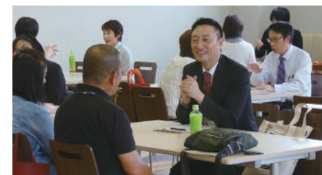
教職員との個別相談(社会福祉学部)