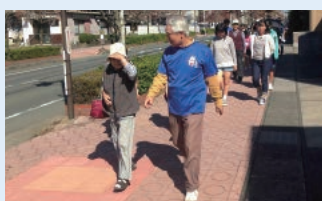
「いぶき」の提案でスタートした高齢者の買い物支援

私たちは、災害時の募金活動のほか湖西市や磐田市の社会福祉協議会と協力した「まちづくり」の活動に関わってきました。特に昨年は磐田市における円卓会議(ラウンド・テーブル)の活動に力を入れました。内閣府の取り組むユース・ラウンド・テーブルを参考に企画を作成しました。見付地区社会福祉協議会と連携し、多様な専門機関や人が集い、対話を行い、地域課題の解決を図る円卓会議を年7回実施してきました。現在は小中学生も関わり、月1回の継続的な高齢者買い物支援の活動に結びついています。