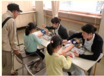
看護学科/血圧測定

看護学部・社会福祉学部・リハビリテーション学部各学科の学びの特色が活かされた健康や福祉に関するブースが設けられました。