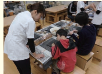
作業療法学科/革細工体験