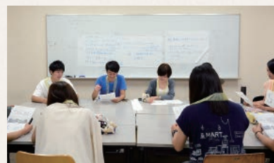
4年次生:事例の検討

9月12日～15日の4日間、4年次生は「専門職連携演習」に取り組みました。看護学部、社会福祉学部、リハビリテーション学部の3学部7学科の学生が対人援助における専門職者同士の連携と協働に関して、その意義と実践方法について理解を深めるために実施しています。これまでの講義や演習・実習などから学んだ経験を再確認し、さまざまな事例に対して他学部学生とともに連携を図ります。