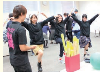
理学療法学科/体力測定ブース