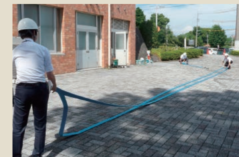
給排水復旧対応訓練の様子。井戸水を汲み上げ、ホースを連結して1号館へ給水します。

イレの確保』を本学園の災害対応力強化の最優先課題として取り組んでいます。本学園の強みである井戸水を活かし、断水・停電時でも、外部業者さんの手を借りず、学園職員だけで校舎内の水洗トイレが稼働できるよう、非常用発電機の実験訓練、給排水復旧対応(市水の給水から井水に切替、ホース連結等)訓練を行っています。災害時はこれらの操作により1号館、3号館1階、5号館、体育館などで水洗トイレの使用が可能となり、学生の皆さんは安心して校舎内に留まることが出来ます。今後、これらの訓練を定着させ、操作できる職員を増やしていきます。