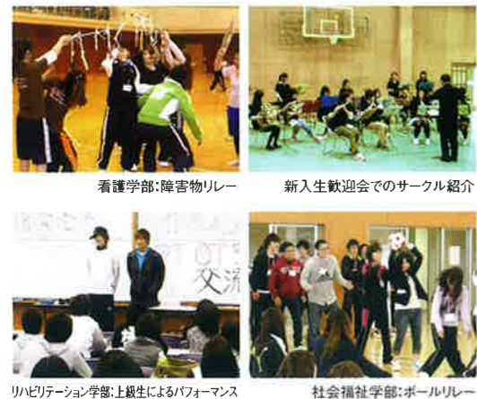
看護学部:障害物リレー

新入生オリエンテーションを行いました 新入生を迎えるにあたり、毎年4月には初年次教育の一環として新入生オリエンテーションを開催しています。学生同士や教員との交流を通して、新入生が大学生活に円滑に適應できるように、3日間におよぶ様々なプログラムを用意しています。今年度は4月6日に全学部合同での新入生歓迎会を開催。本学学生によって組織されている学友会が主催となり、音楽系・スポーツ系・文化系・ボランティア系といったさまざまな分野のサークルの紹介を中心に、上級生・新入生との交流を深めました。 また、4月5日～7日の期間に各学部による「新入生セミナー」を実施。上級生が中心となって考えた企画によりスポーツや座談会など各学部ごと趣向を凝らした内容で行われ、新入生の皆さんを歓迎しました。