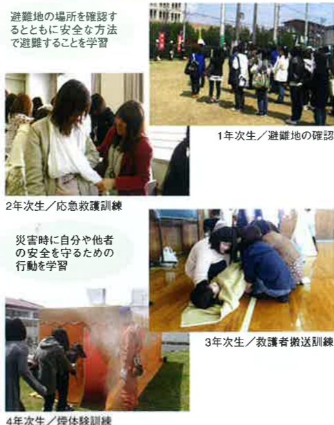
1年次生/避難地の確認