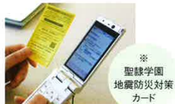
※ 聖隷学園 地震防災対策カード

聖隷学園の地震防災対策の基本事項を記載しており、中でも、大地震発生時に学生の安全を確認するための「聖隷学園安否情報システム」はインターネットにつながる携帯電話を使って学生自らが自身の安否情報を大学へ送信するものです。大学ではこのシステムを利用して学生の安全を把握します。他にもこのカードには、避難地の案内や大地震に備える基本行動をまとめ、学生たちには常時携帯するように呼び掛けています。