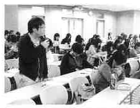
リハビリテーション学部「就職活動報告会」

各学部で4年次生が先輩たちに就職・進学活動についての体験を話します。どのような就職・進学活動を行ったのか、その実際を聞くことにより、在学生が就職活動を実感し、やる気を起こす場になっています。