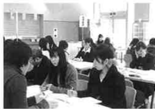
看護学部「卒業生と在学生との懇談会」

就職活動を開始する3年次生を対象にして将来目標の確立、大枠で自分の進路を決めることを目標としています。学生が様々な進路(就職)について具体的なイメージを持ち、行動へと踏み出せるよう、実際に保健医療福祉施設で活躍している卒業生に話を聞きます。