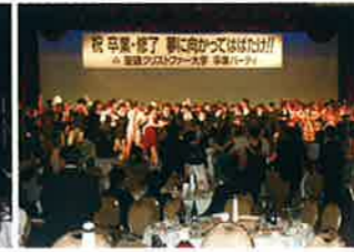
参加者全員での大合唱「栄光の架け橋」