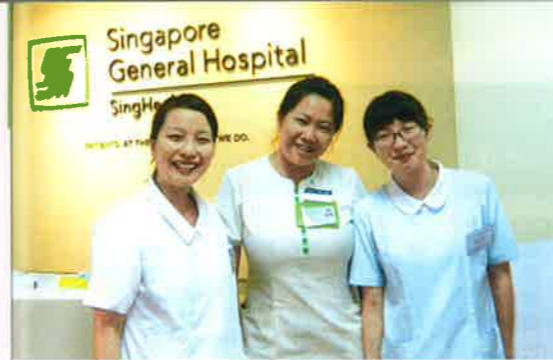
シンガポール総合病院の看護師と