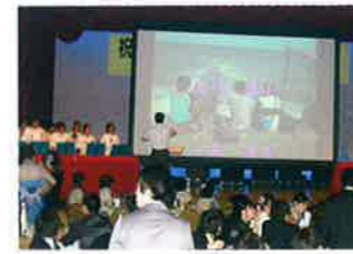
看護学部によるハンドベルと思い出の写真