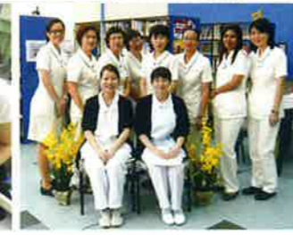
HPBの看護師のみなさんと

※ナースシャドウイングとは、看護師にマンツーマンで「影」のように密着して行動を共にし、その仕事ぶりや職場の雰囲気を観察することです。