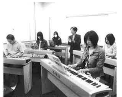
3年次生「実習・就職対策ピアノレッスン」の様子

社会福祉学部は、子ども教育福祉学科を開設し3年目を迎えました。今後の学生の就職に備えるために、「音楽実技教育」を強化していきます。幼稚園教諭や保育士の採用試験では、基本的な能力の確認として音楽の実技テストがあるのが一般的です。これに対応できるように授業や授業以外にもレッスンをできるようにしていきます。