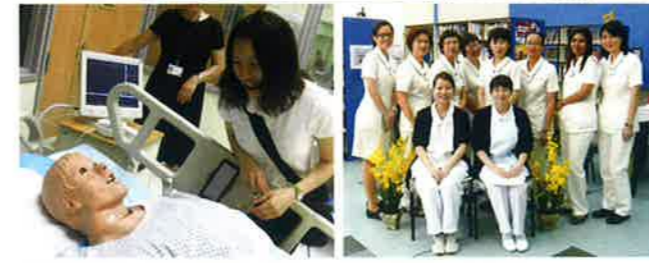
NYPにてコンピュータモデルを用いた演習