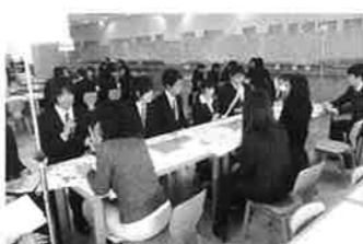
社会福祉学部「学内就職相談会」

学生が保健医療福祉施設の採用担当者や直接話をすることにより、学生の就職活動への動機付けと応募先検討の機会としています。また、学生の確かな就職を実現するために参加した保健医療福祉施設との関係を強くすることも目的としています。就職活動が本格的に始まる前にとり、これから、看護学部は4年次の6月、リハビリテーション学部は4年次の8月、社会福祉学部は3年次の2月に