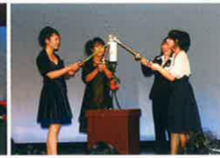
卒業後も聖隷の精神を大切にすることを誓ったキャンドルサービス