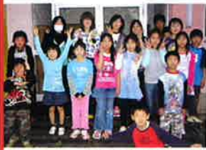
TOLOの学生と子どもたち