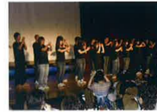
社会福祉学部による唱歌、曲は「Song for〜」