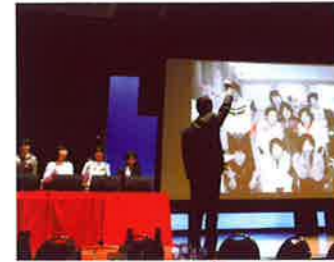
看護学部教員によるハンドベル演奏。思い出の写真も。