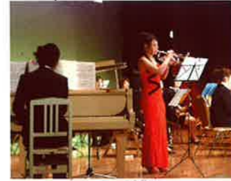
卒業生のピアノとトランペットによる「トロイメライ」 恒例の手話歌。今回は「song for～」

3月16日(月)アクティビティ浜松中ホールでの卒業式・修了式の後、グランドホテル浜松にて卒業パーティ(後援会・学友会・同窓会・大学共催)が行われました。様々なお祝いの企画の最後には、聖隷の精神を卒業生から在校生に引き継ぐセレモニーとして「キャンドルリレー」が行われました。卒業生・修了生、関連施設・病院からの来賓の方々、保護者の方々を含め、総勢約840名が参加し、盛大なパーティとなりました。