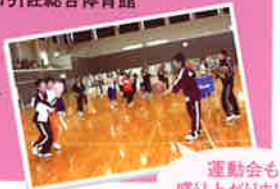
運動会も盛り上がりました!

●運動会 ◎浜松市引佐総合体育館 午前/ドッジボール 長縄 午後/2人3脚 障害物リレー