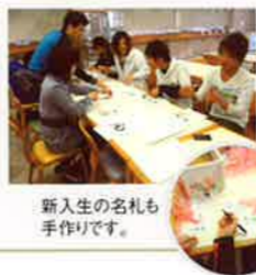
新入生の名札も手作りです。

セミナー前日。学生ホールでは先輩たちが準備を進めていました。おつかれさまでした!