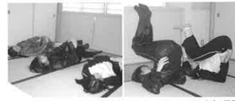
エクササイズの様子

そこで、月経を中心に女性の体のメカニズムを学び、月経随伴症状に対応する力をつけるために、月経教育プログラムに基づいて「マンスリーピクス教室」を10回コースで実施しました。さらに大学生は様々な環境の中で月経随伴症状と自尊感情が互いに影響していることが考えられるため、身体面のみではなく、「より自分を愛することができるように」という目的で、自尊感情を向上させるためのエクササイズも取り入れました。