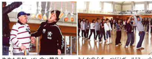
先生も参加。パン食い競争☆ みんなの心を一つにバレーボール☆

最終日は体を動かしながら、新入生、上級生、そして先生方と入り混じって楽しく交流しました。