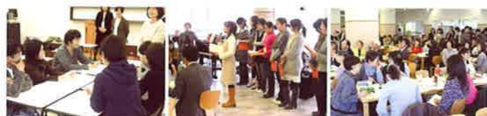
テーマ別多職種交流会 卒業生による合唱 ランチパーティ