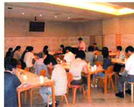
参加者は教員・院生・受講生合わせて38名、軽食をとりながらリラックスした雰囲気の中で積極的な意見交換がなされました。