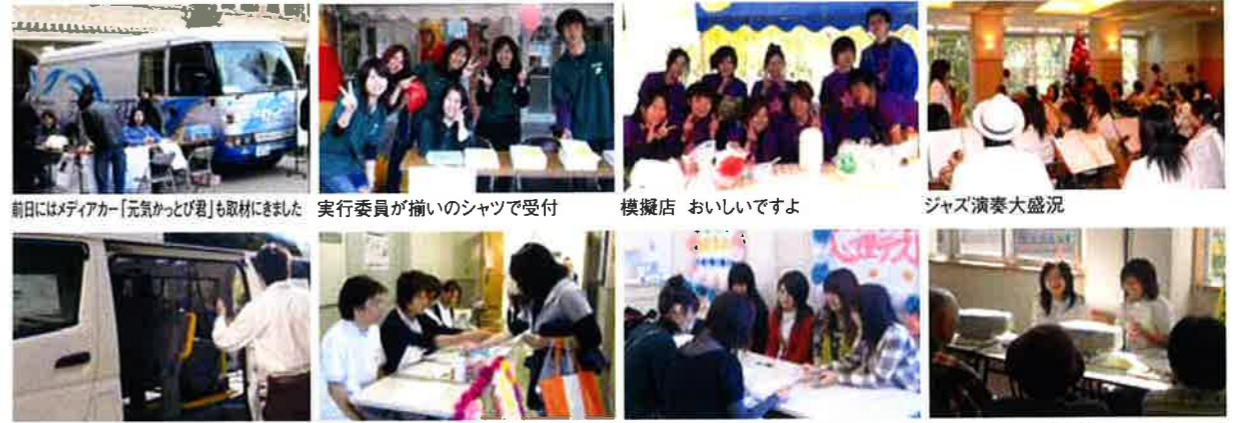
前日にはメディアカー「元気かつび君」も取材にきました 実行委員が揃いのシャツで受付 模擬店 おいしいですよ ジャズ演奏大盛況 福祉車輛の展示もしました 恒例の健康祭り/左から:アルコールバッチテスト(看護学部)、心理テスト(社会福祉学部)、純音クイズ(リハビリテーション学部言語聴覚学専攻) どなたでも参加できます

甲斐あつてが、例年より多くの方々にご参加いただきました。恒例の健康祭りでは各学部の特色を生かした活動ができ、聖隷クリストファー大学では普段どんな活動をしようかと学んでいるなど、一部ですが知っていただけではなかったと思います。これも各実行委員を始め、模擬店や各サークル等の有志の方々、並びに共に聖灯祭を盛り上げてくれた皆様のご協力のおかげだと感謝しています。これからも学外へ積極的に聖灯祭の輪を広げていき、ボランティアの方地域の方と体となり更に盛り上げていけたらと思います。 当日足を運んでくださった方々を含め、協力してくれた皆の笑顔とパワーで活気づいた今回の聖灯祭は、「煌々power of smile」というテーマと共に皆の心の中で思い出さずにはいられない思い出の瞬間として残っています。