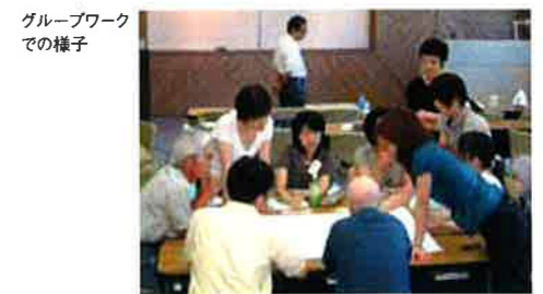
グループワークでの様子