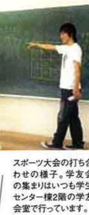
スポーツ大会の打ち合わせの様子。学友会の集まりはいつも学生センター2階の学友会室で行っています。

次に、告知の方法も変更しました。従来は掲示板への掲示のみでしたが、今年は開催通知と参加申込書が一緒になったチラシを作成して、学生全員が参加する秋 semester ガイダンスで配布しました。これなら学生全員の目に留まるので、いつもより学生への周知は広くできたと思います！