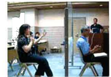
教員の陥りやすい落とし穴実験(スキーマ体験)の様子