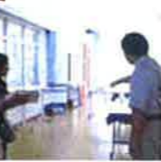
神戸愛光園での研修の様子

を更に深め、姉妹団体として互いに維持発展していくことを目的として、聖隷学園をはじめ、遠州栄光教会、聖隷福祉事業団、神戸聖隷福祉事業団、牧の原やまばと学園、その他聖隷関連施設にて、充実した研修を行っています。