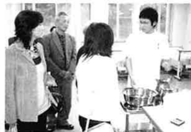
看護学部:基礎看護実習室/学生が実技の練習をしているところを見学できました。