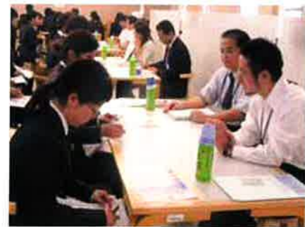
参加した学生からは「各病院・施設によって雰囲気の違い、その中で就職について深く考えることができた」「大変参考になった。このような話を聞く機会が自分ではなかなか作れないため、この会をきっかけに自分で行動に移りたい」などの感想が聞かれました。

就職支援 今年度初めて卒業生を送り出すリハビリテーション学部 初めての病院・施設説明会を行いました