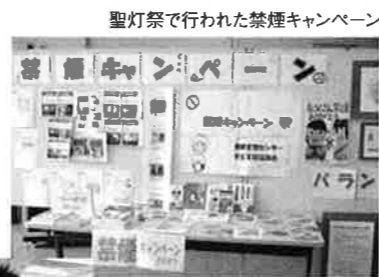
聖灯祭で行われた禁煙キャンペーンの様子。スモーカーライザーは健康管理センターに常備されています