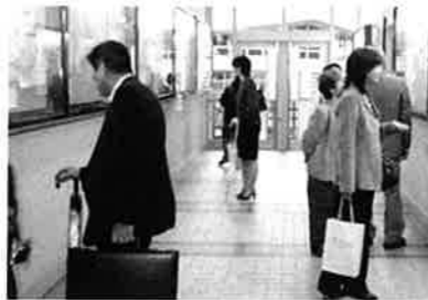
掲示板を見学する保護者の方々