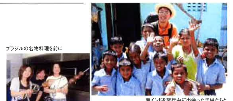
ブラジルの名物料理を前に