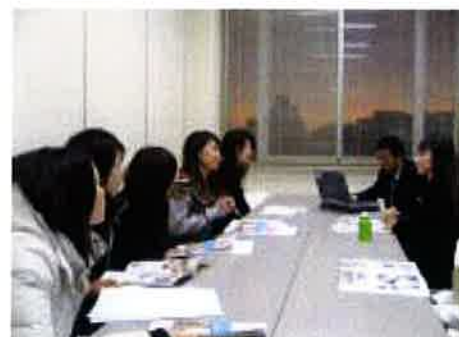
懇談会に参加した学生たちからは、「働いている先輩と交流がもてたことで、勇気付けられた」「就職への不安が軽減した」といった感想も

1月10日に、看護学部3年次生を対象に就職講演会・卒業生との懇談会を開催しました。