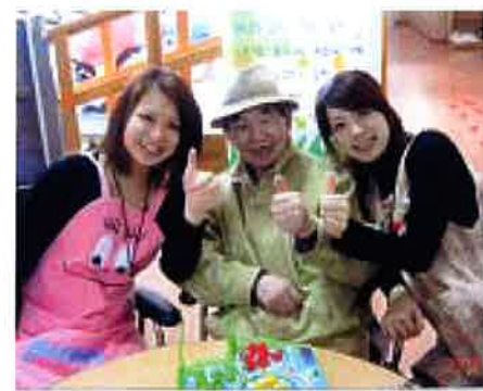
韓国の老人福祉施設にて

の上、実習計画を作成していきます。実習前には事前学習として訪れる国の地理、歴史、文化、政治状況、生活の実態、そして福祉の制度などを個人、またはグループで調べたり、その国を訪れたことのある先輩の話の聞いたりして、総合的に理解します。 実習期間中、学生は現地の実習指導者の指導を受けます。また、実習記録(日誌)をつけます。朝起きてから夜寝るまでの間自分がしたこと、そこで体験したことや感じたことを書き留めます。 実習終了後には、事後学習として実習レポートを作成し、年度末に行われる実習報告会で実習の成果を発表します。 この実習は、準備された既存のプログラムに参加するのではなく、実習先・スケジュールの検討、決定からチケット手配までのすべてを、担当の先生と相談しながら学生が自分自身で行う点に特徴があります。