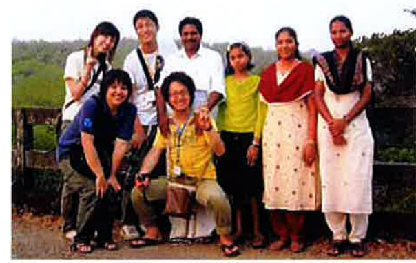
インド聖隷希望の家にて