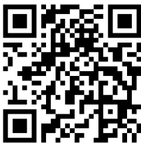
図1. 社会資源アプリのQRコード

社会資源アプリ『いなさで暮らそうマップ』、『細江で暮らそうマップ』、『三ケ日で暮らそうマップ』は図1のQRコードで示す。QRコードをタブレットやスマートフォンで読み込むことで実際に使用することができる。社会資源アプリのホームページは図2に示す。また、紙マップ冊子は図3に示す。