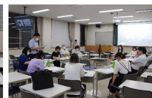
社会福祉系実行員