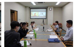
リハビリテーション系実行委員