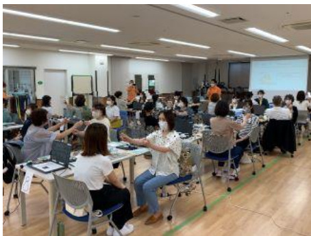
図 3. 透明文字盤の体験