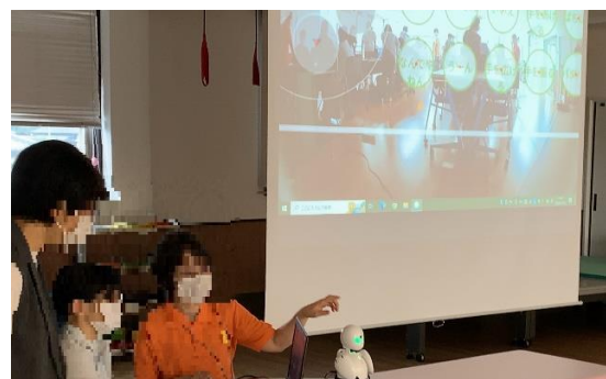
図 4. 分身ロボットの操作体験