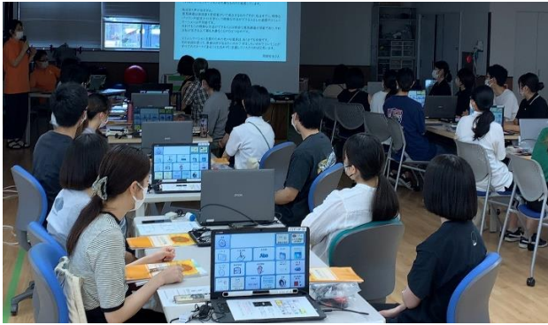
図 1. ICT 救助隊による講義