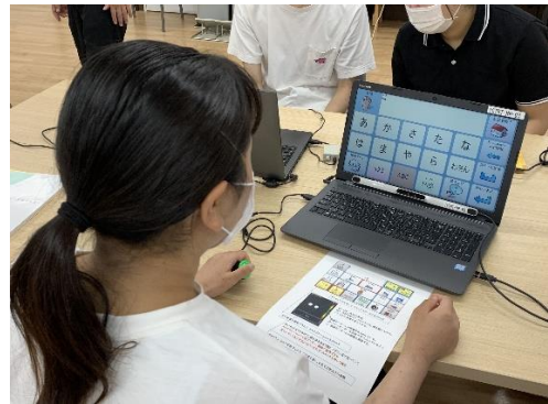
図 2. 視線入力装置の操作体験

専門職者を対象とした 7 月 23 日（日）の参加者は 31 名であった。職種は、看護師が 11 名、作業療法士が 11 名、言語聴覚士が 4 名、理学療法士が 3 名、介護福祉士が 1 名、ケアマネジャーが 1 名であった（表 2）。