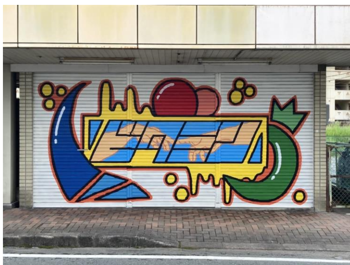
写真 12. アーティスト鈴木海斗氏の作品