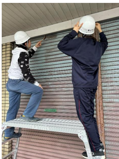
写真 11. 本学学生の参加