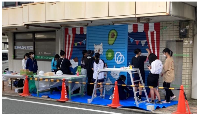
写真 10. IE 高制作風