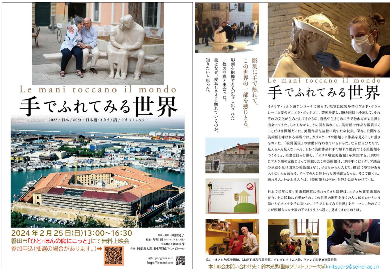
写真 13. 『手でふれてみる世界』上映会チラシ

また、協力者の笥有子氏（浜松学院大学 准教授）・島口直弥氏（浜松市美術館 指導主事）にも当日の運営や事後の振り返りなどご協力いただいた。