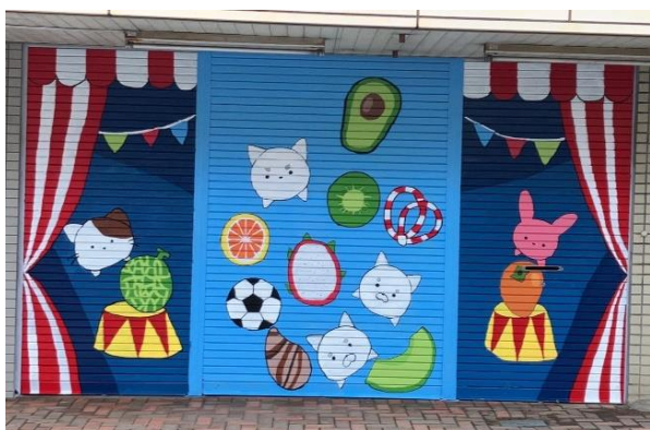
写真 7. 2023 年 7 月 IE 高制作