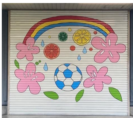
写真 8. 2023 年 4 月 IW 高制作