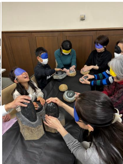
写真 15(中) 石彫作品触察