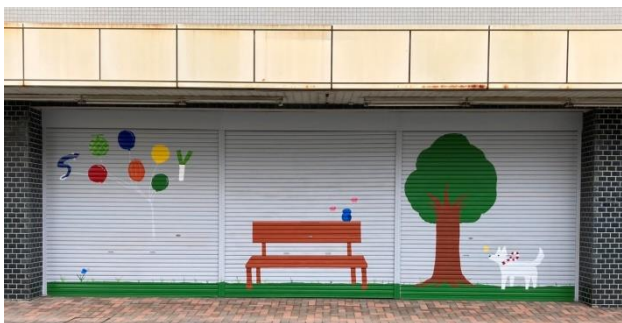
写真 5. 2023 年 4 月 IA 高制作