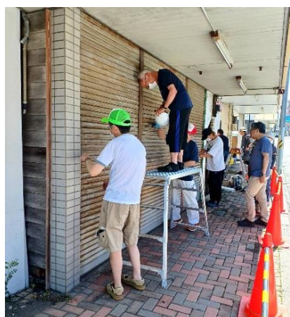
写真 9. 住民による錆取り