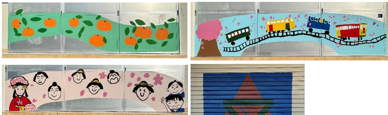
写真 1 (左上) みかん 写真 2 (右上) 天竜浜名湖線 写真 3 (左下) 姫様道中 写真 4 (右下) 校章