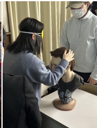
写真 16(右) シリコン作品触察