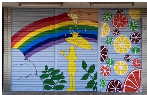
写真 6. 2023 年 4 月 IA 高制作